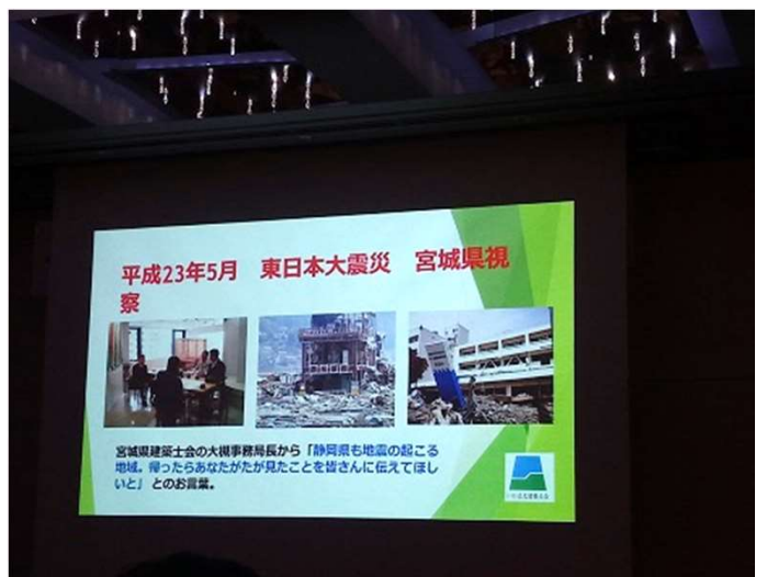
志太建築士会の10年の歴史、歩み