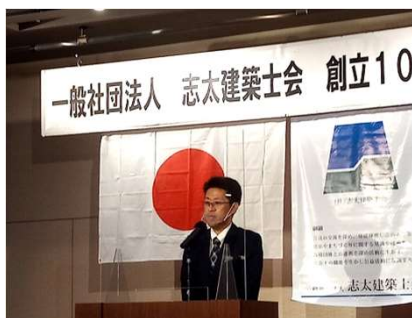
塩澤副会長 閉会挨拶