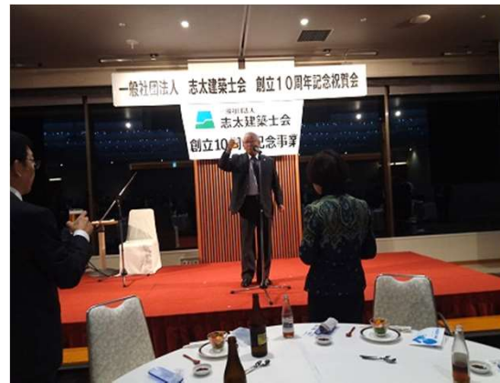
水野記念講演部会長による乾杯