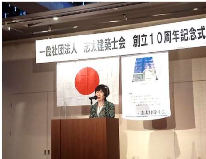
島田市長 染谷絹代様