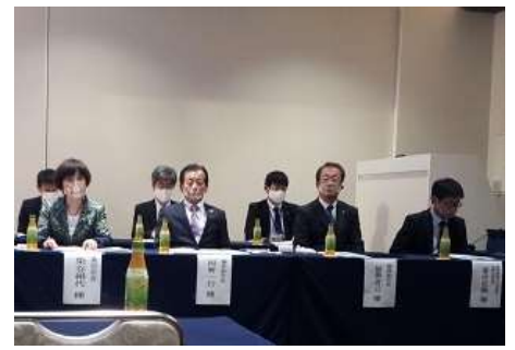
多くの御来賓に皆様にもご臨席いただきました。