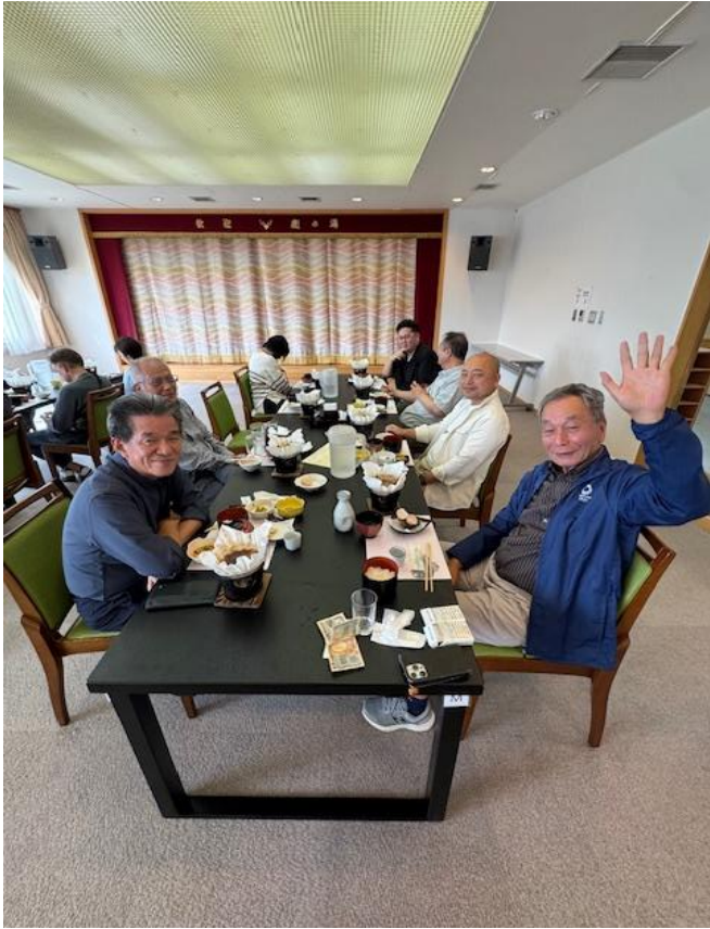
昼食後は「サントリー白州蒸留所」（ウイスキー博物館・セントラルハウス）