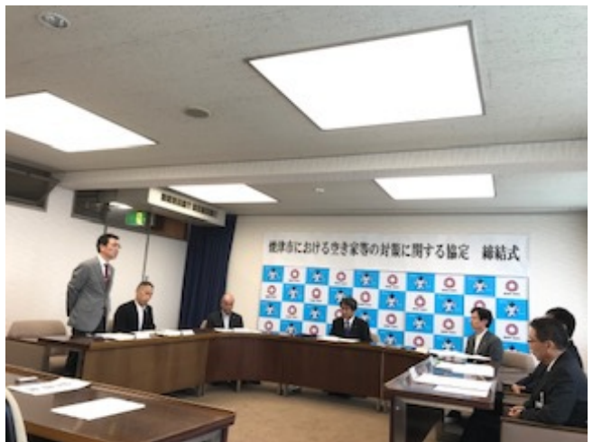
(一社)志太建築士会会長が会の紹介をしました。