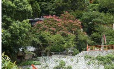
守り神？ 百日紅の木