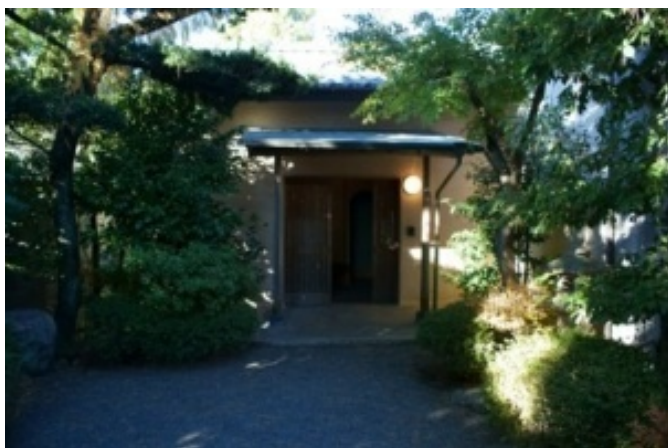
昭和27年に増築した場所、昭和の時代が感じ取れます。