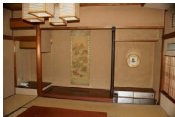
各部屋に床の間があります。