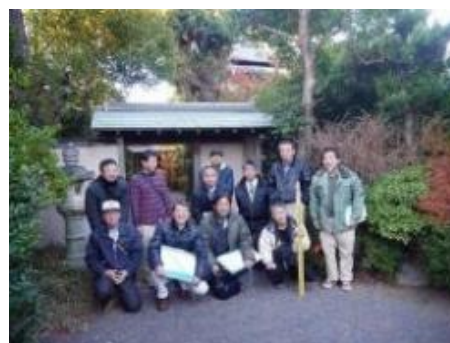
最後に集合写真を撮って解散しました。