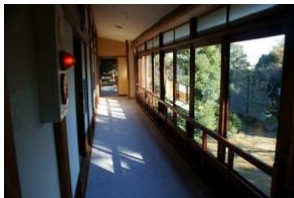
1階の廊下、昭和7年移築。