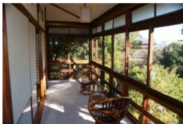
2階の廊下、昭和27年増築