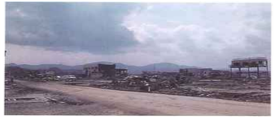
気仙沼市被災地の現在の様子、平成23年8月10日 戦争は経験していないが“戦場”のように見えた・・・