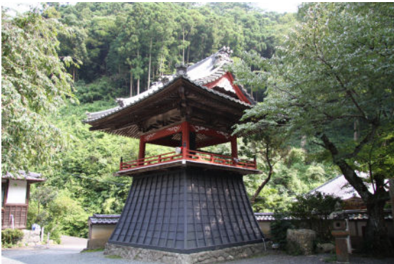
袴腰付きの古い鐘楼