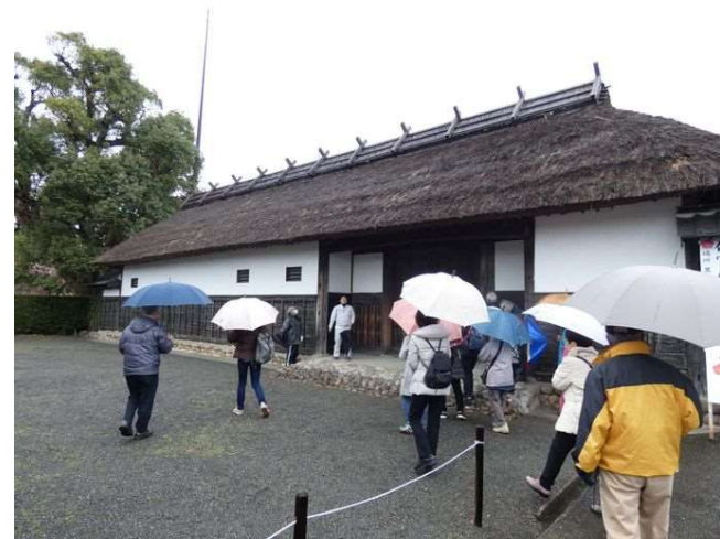
菊川の黒田家住宅は、菊川市職員の説明があり、わかりやすかった。写真は長屋門です。

参加者：市民17名、文化財課2名、まちづくり委員会5名 9：15郷土博物館出発し、黒田家住宅、高天神城跡、油山寺と廻、16：00郷土博物館着